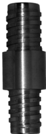
Acople de tubería de perforación