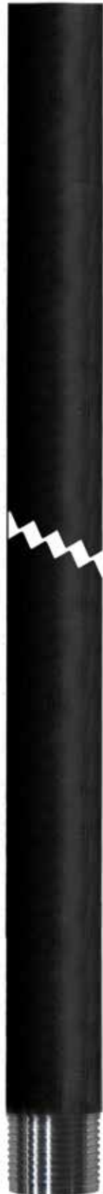
Tubería de revestimiento