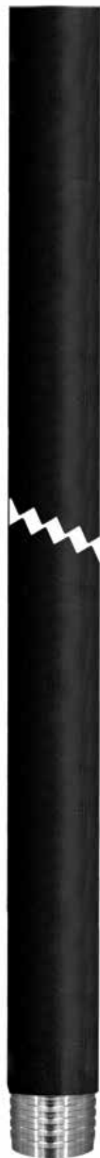
Tubería de perforación wireline